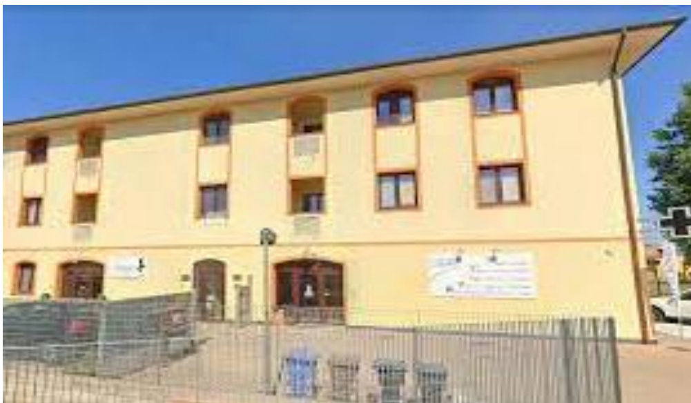
- PONTE A EGOLA, GENNAIO 2022

VIA CORRIDONI N.68 _ PONTE A EGOLA - S.MINIATO B. (PI)